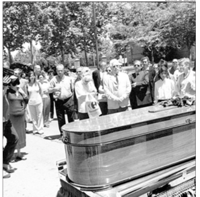
En la Almudena. Los restos de Mampaso, ayer, antes de ser incinerados

-Felipe II jugaba a todos los palos. Daba carrete al partido belicista y al pacifista, metía fuego a los sodomitas y no te cuento sus prácticas. Felipe II era bifronte. Tenía dos caras. Hay una cara oculta de Felipe II y yo he tratado de contar esa cara oculta.